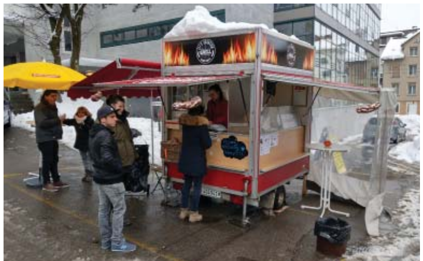
Sogar im Winter kann man gut geschätzt seine Wurst gleich bei Eli's Quartiergrill verzehren.