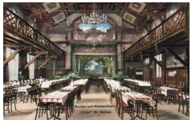
Die Konzerthalle vom Restaurant Uhler (ehemals an der Bogenstrasse, abgebrochen 1955) fasste rund 600 Gäste und wurde für die Fasnacht jeweils aufwändig dekoriert.