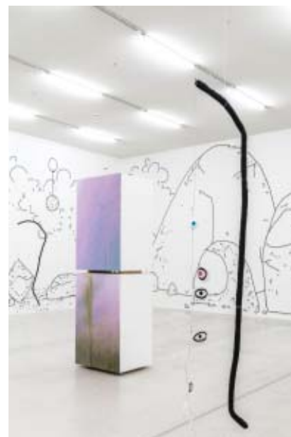
Zin Taylor Installation view of Creative Writing, 2017