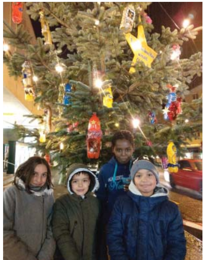
Einige der kleinen ChristbaumschmückkünstlerInnen vor dem Quartierchristbaum, danke schön für den kreativen Schmuck!

sind auf www.tirumpel.ch und auf den Plakaten im tiRumpel Schaufenster/ Brache Lachen Info-tafel/Schaukasten Zürcherstrasse 45 zu sehen.