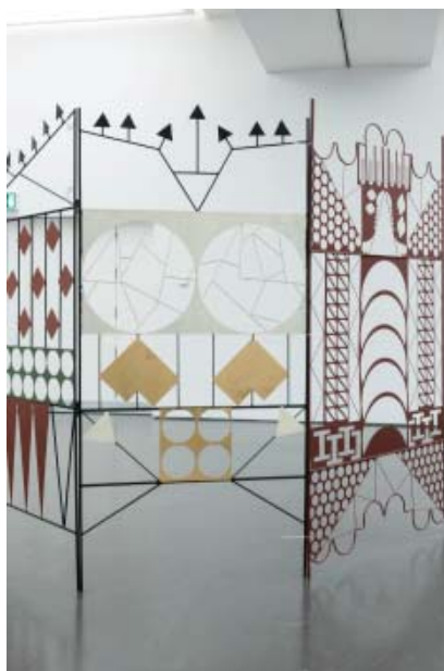
Kasia Fudakowski For How Much Longer Must We Improvise? II (Panel 1-3), 2011, Courtesy the artist and ChertLüdde, Berlin Photo: Katja Illner