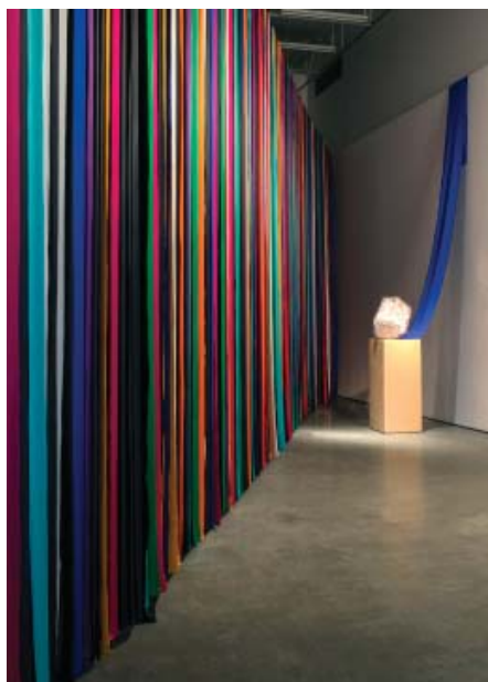
Grace Schwindt Curtain, 2016