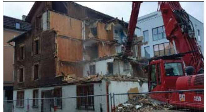
Die Abreissarbeiten beginnen ...

Unser Lachen-Quartier im Bereich Ulmenstrasse / Metallstrasse kommt nicht zur Ruhe. Noch im vergangenen Jahr fuhren nämlich an der Metallstrasse erneut Bagger auf. Die beiden etwas kleineren Gebäude Nr. 16 und 18 sind bereits verschwunden, das stattliche Haus Nr. 20 wird in den kommenden Wochen ebenfalls abgerissen werden. Damit entsteht nochmals viel Platz für Neues. Die Immobilien Verwaltung Abler (IVA GmbH) ist überzeugt, dass der Ort sowohl zum Wohnen als auch für Geschäfte äusserst ideal ist. Sie hat deshalb mehrere Jahre in die Planung einer Neuüberbauung der Metallstrasse 16-20 investiert. Dabei wurden Pläne erstellt, angepasst, wieder verworfen und schliesslich so weit vorangetrieben, dass seit rund 8 Monaten die Baubewilligung für ein einziges, grossvolumiges Wohn- und Geschäftshaus mit Autoeinstellhalle vorliegt. Zum Wohnen werden vor allem kleinere Mietwohnungen und möblierte Studios entstehen; bezüglich Gewerbe sind ebenfalls bereits erfolgversprechende Verhandlungen