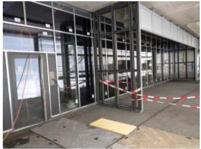
Schon bald öffnet die Migros diese Türen.

Zusätzlich findet am 9. Februar 2019 ein Tag der offenen Tür für Mietinteressenten statt. Sie werden dann die Gelegenheit haben, die fertige Musterwohnung zu besichtigen.