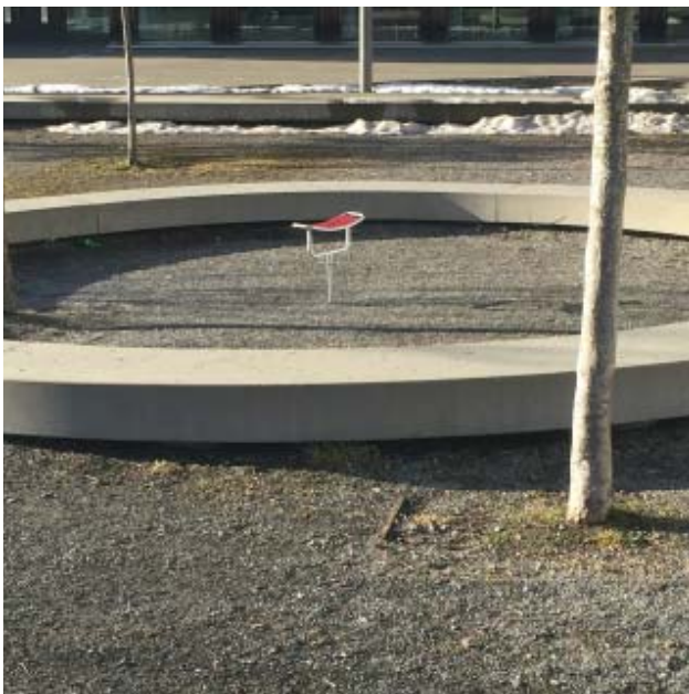
Schöner Sitzring mit Stuhl in der Mitte beim Schulhaus Schönenwegen

Von jedem Spielort gelangt man zu Fuss oder mit dem ÖV zum nächsten Ort. Alle Spielorte des Spielwegs und die städtischen Spielplätze sind dank unserer Spielwegkarte leicht zu finden. Es geht auch digital: auf www.spielweg.ch werden die Spielposten via Google Maps angezeigt. Hier sind bis zu 10 Spiele pro Posten abrufbar. Entwickelt