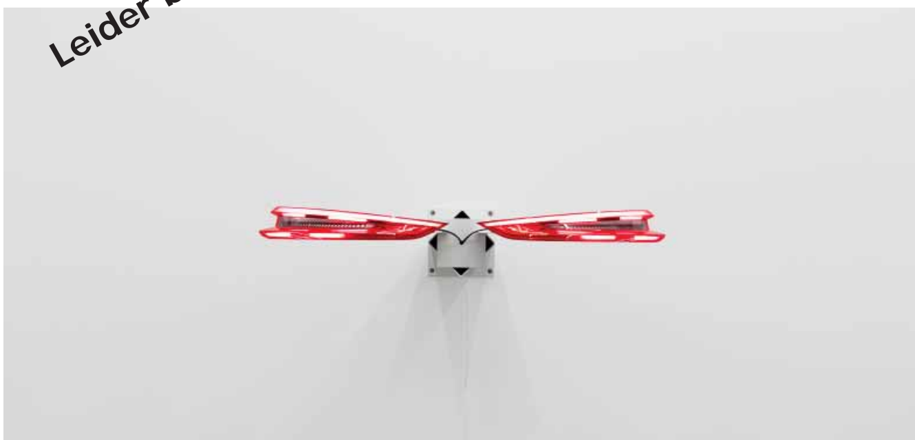
Yngve Holen, Hater Taillight , 2016