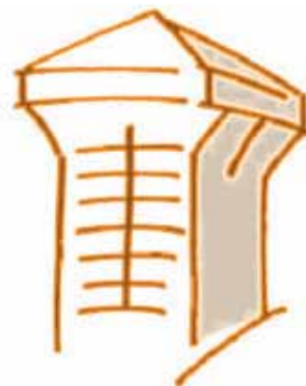
Eine Veranstaltung des Quartiervereins Lachen www.qv-lachen.ch

Anschliessend lädt der Quartierverein Lachen alle Gäste zu einem Apéro ins Restaurant Eidgenössisches Kreuz an der Zürcherstrasse 25 ein.