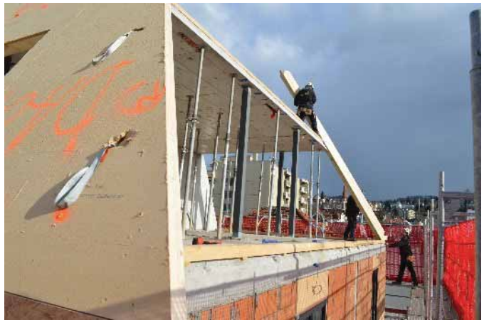
Höher geht nicht mehr ..... wohnlicher schon

Und diese können sich auf einen „Ort zum Verweilen“ an bester Stelle und mit schönstem Ambiente freuen. In dem 5-stöckigen Haus an der Metallstrasse – mitten im Lachenquartier - entstehen nämlich auf 4 Etagen gut 50 Kleinwohnungen – kleine Oasen für Menschen, die in St. Gallen für eine Nacht, mehrere Wochen oder gar Monate ein Zuhause suchen oder brauchen.